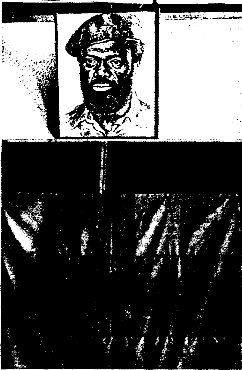
Um "poster" de Savimbi foi o pretexto para a crise do Lobito

Outros incidentes em diversos pontos do território têm sido noticiados pela imprensa local. Em Menongue, província