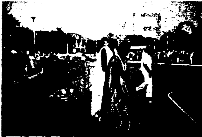
Também a Guiné-Bissau procura desenvolver a sua economia na base da iniciativa privada