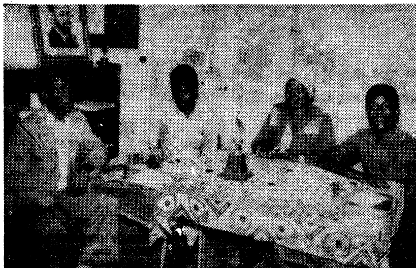
A OMM e a OJM desempenham um papel fundamental no esclarecimento de casos da Mulher e do Jovem, em situação irregular. Na gravura, membros das ODM's no Bairro da Costa do Sol. .....