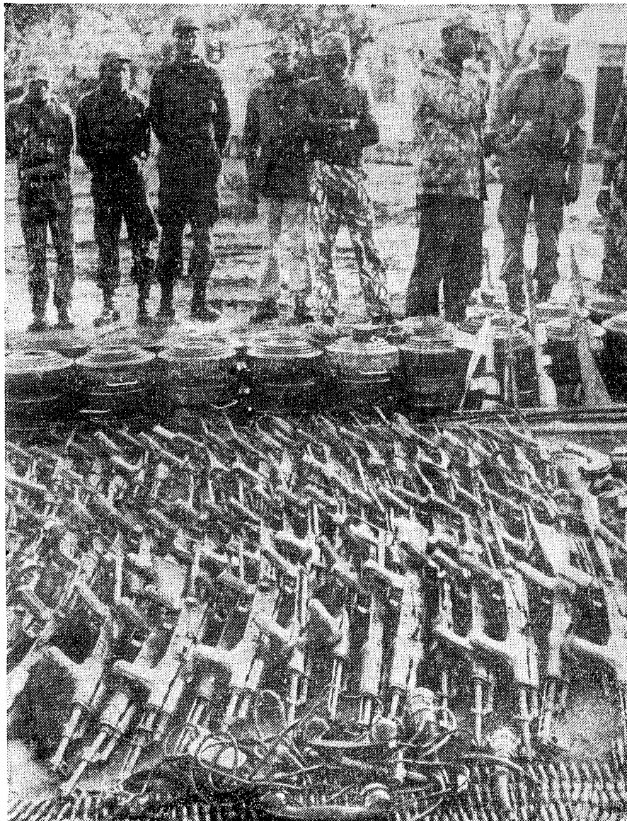
Parte do material apreendido aos bandidos armados pelas nossas forças, em Gaza.

Nas operações de reconhecimento levadas a efeito pelas FAM/FPLM, a população também tem prestado valiosa contribuição, dando indicações sobre a localização dos acampamentos inimigos e dos seus colaboradores infiltrados entre os moradores nas aldeias e povoações.