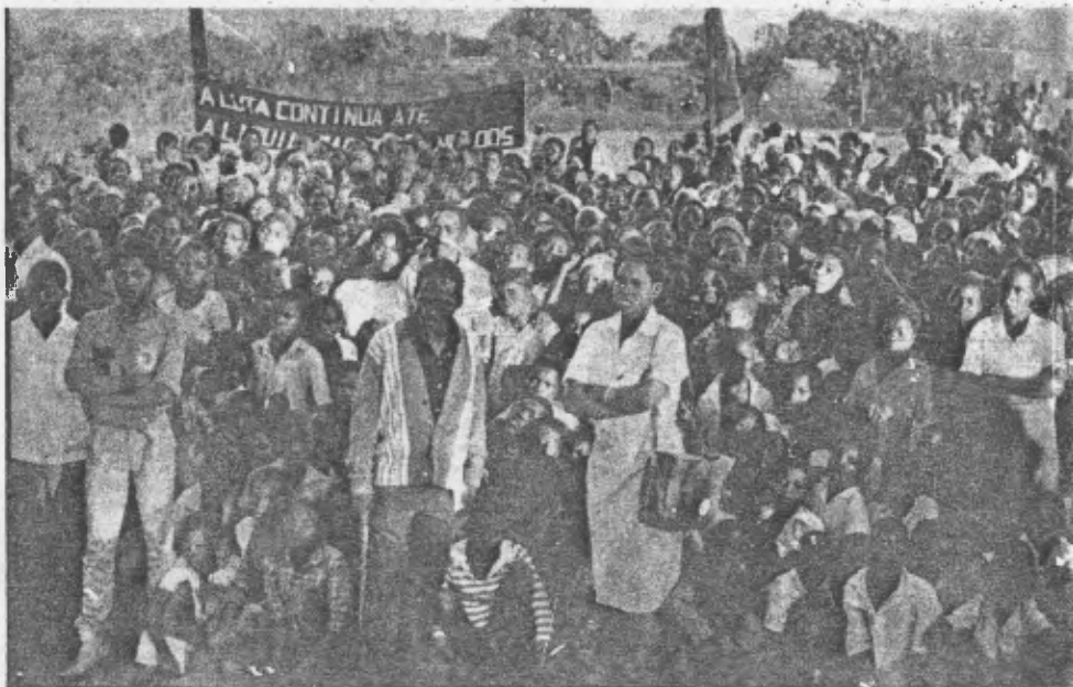
Parte da população presente no encontro