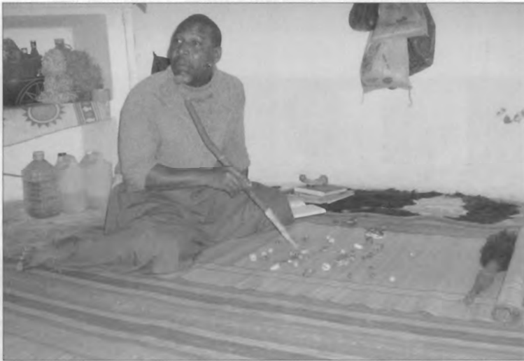
Figura 6 – Explicando o problema que aflige o cliente.

“Quando isso acontece, não me vem sequer à cabeça nenhuma preocupação de estar certo ou errado, de convencer ou não. Passado um bocado, já nem sequer olho para os “ossos”. O cliente pensa que eu estou a lê-los, mas eu estou só a falar, a falar, falar, e sem mesmo notar estou de olhos fechados e continuo a falar, a falar, até não ter mais nada para dizer. E quando me calo, normalmente não há mesmo mais nada para dizer, ou para atirar.”