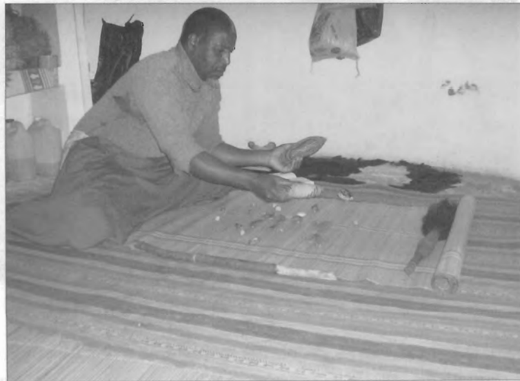
Figura 5 -- Lançando o tinhlolo completo, de uma bolsa sipatsi .

Esta insegurança é legítima, mesmo de acordo com os seus próprios critérios. De facto, para além da incorporação do espírito, uma boa consulta requer também que este esteja de bom humor e que a sua interacção com os antepassados do cliente seja mutuamente aceite. Por isso, mesmo um bom adivinho pode por vezes sentir-se inseguro ou incapaz de fornecer informações correctas; mas, como a sua reputação está em jogo, tentará utilizar a sua experiência e capacidade de observação para descobrir o assunto que preocupa o cliente.