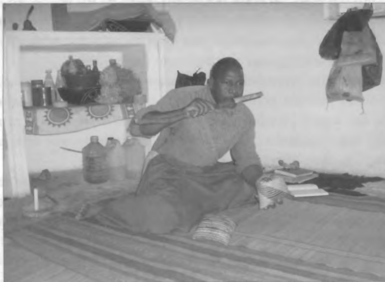
Figura 4 – Mordendo madeira de manono, para auxiliar a indução de transe ligeira.

A partir do momento em que o adivinho sente a sua presença, poderá “ bater ” (lançar) o tinhlolo (figura 5). Se já está familiarizado com o cliente, poderá utilizar apenas o tinhlolo Nguni ; mas se se trata de uma primeira consulta ou se espera que ela venha a ser importante (devido ao estatuto elevado do cliente ou à expectativa de um problema particularmente complicado), será de esperar que o nyanga “ jogue seguro ”, atirando também as escamas de crocodilo e as nozes de nulu . A ideia é poder comparar os padrões desenhados pelos dois conjuntos mais pequenos com aquele em que caíram as muitas peças do tinhlolo mais complexo: numa consulta promissora, os três conjuntos deverão fornecer basicamente a mesma informação; se tal não acontece, algo está mal. Para além disso, os conjuntos de seis peças, mais simples, podem ajudar o adivinho a focar a sua atenção na mais pertinente de entre as várias linhas de leitura proporcionadas pelo conjunto maior.