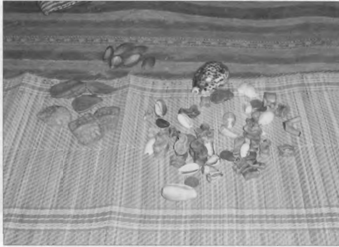
Figura 1 – Um conjunto completo de tinhlolo, em 2005.

Não obstante, podemos dizer que, de momento, existe um tendencial padrão básico de tinhlolo no sul de Moçambique. Na sua versão completa, ele inclui na verdade três conjuntos diferentes (figura 1).