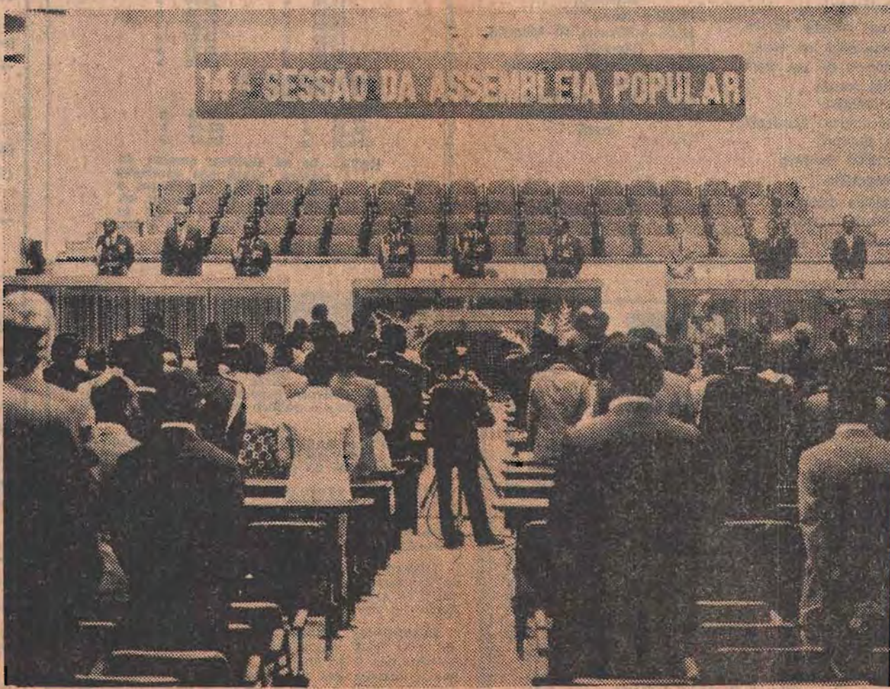
Deputados da Assembleia Popular, na abertura da 14.ª Sessão, que decorre na capital do País

Senhores Deputados, Tivemos a honra de ser enriquecidos de personalidades que ao visitarem o