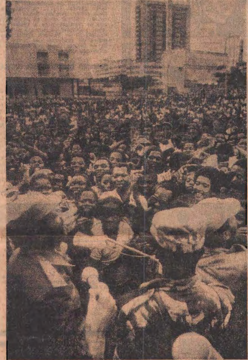
Jovens, crianças e mulheres misturavam-se numa multidão ansiosa de ouvir as palavras do Presidente Samora Machel. Foi assim em Nacala e em todo o sítio

Finalmente, saudamos o calor humano, o acolhimento fraternal e carinhoso, o amor, a alegria com que a