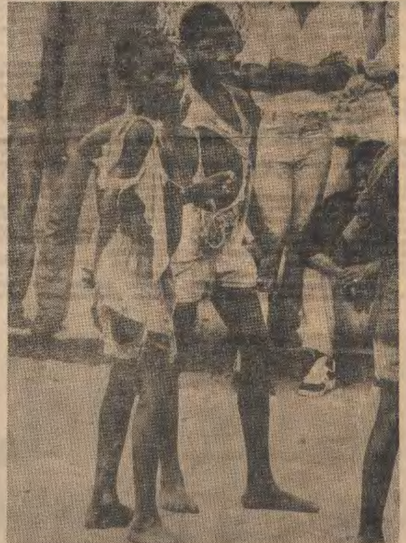
Não falta comida, mas faltam outros artigos, como é o caso da roupa

A Polícia não representa uma tribo, ela não é o poder de uma tribo, de uma raça. A Polícia deve fazer justiça a todos, sem olhar a quem. A Polícia deve fazer justiça a todos, independentemente do seu estado