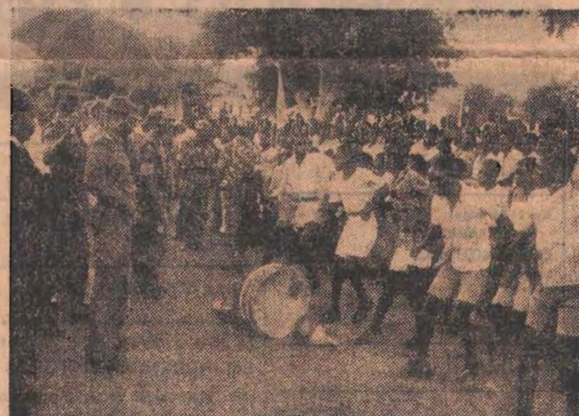
A chuva que começou a cair não fez a população de Ribaué arredar o pé. Pelo contrário, a festa continuou com vigor

Nós, veteranos, não queremos viver do passado. Temos que fazer a nova História, deixar que os jovens se formem, para também haver novos gene-