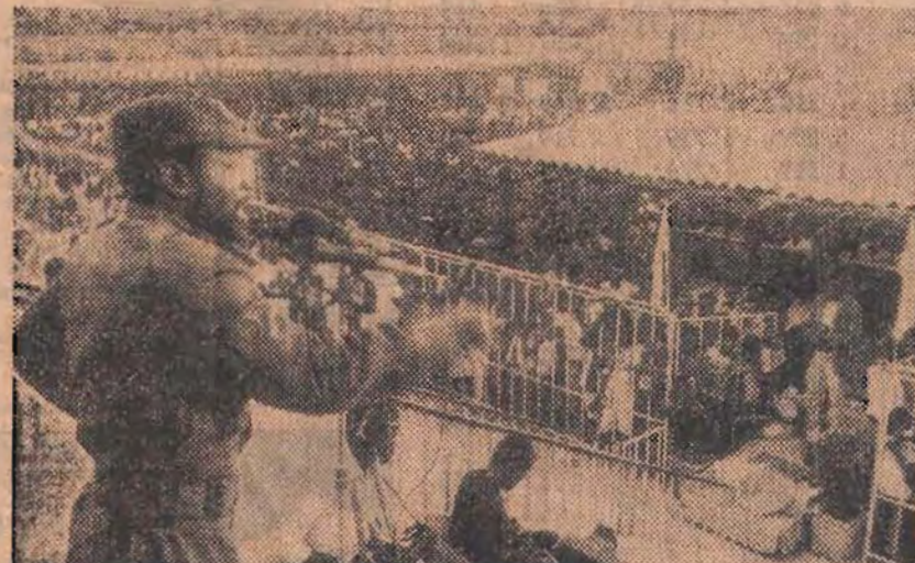
Acabar com os bandidos armados passa pela reorganização do Aparelho do Estado, do Partido e por um conhecimento profundo entre nós, ao nível da localidade, do distrito, da província, até à Nação.

Isto que estou a dizer-vos não é novo. Foi já discutido pela 3.ª Sessão do Comité Central e pela 12.ª Sessão da Assembleia Popular. Foram aprovadas resoluções que contêm as tarefas das Forças Armadas, do SNASP