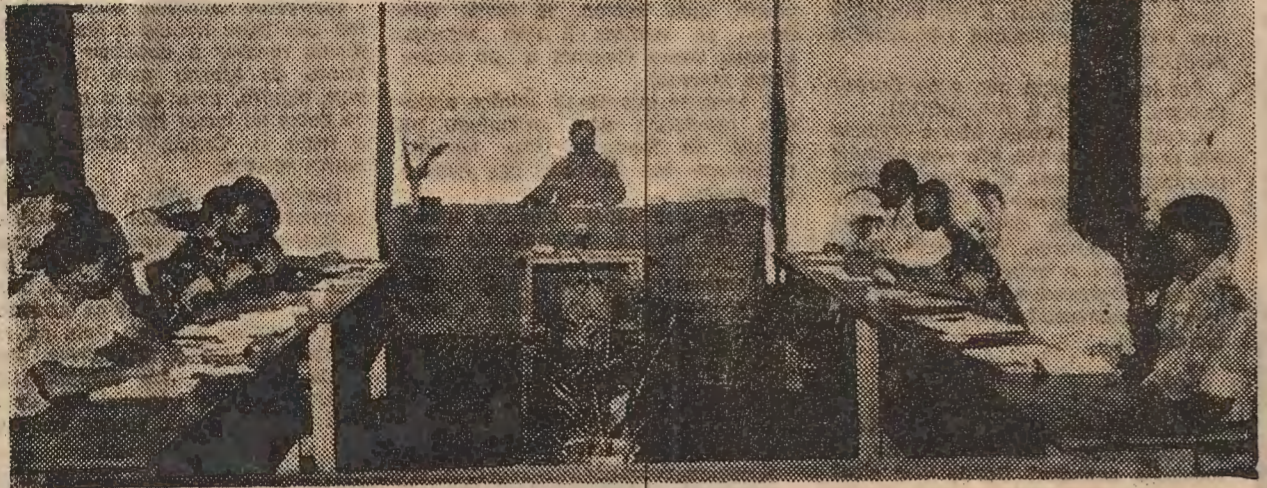
Pela primeira vez, o Bureau Político do Comité Central do Partido Prelimo realizou uma reunião fora de Maputo

Como é que este jovem vai falar com um cooperante psicólogo, engra-