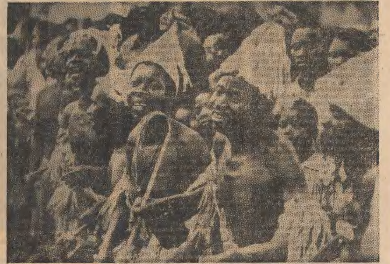
As manifestações culturais foram uma constante por todo o sítio por onde passou o Presidente Samora Machel. Foram apresentadas canções e danças não só de Nampula como também de outras regiões do País

Quando somos educados e estamos preparados, sabemos distinguir os erros do indivíduo e os da própria política. Entenderam? (SIM!)