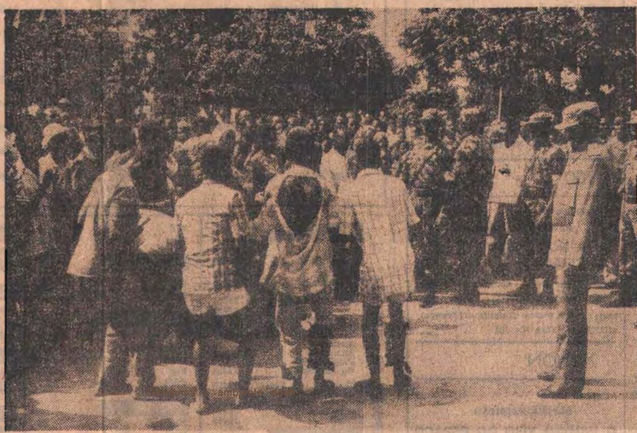
A maioria dos grupos culturais era constituída por jovens. Este é de Nacala

venciais, os directores das empresas, das fábricas.