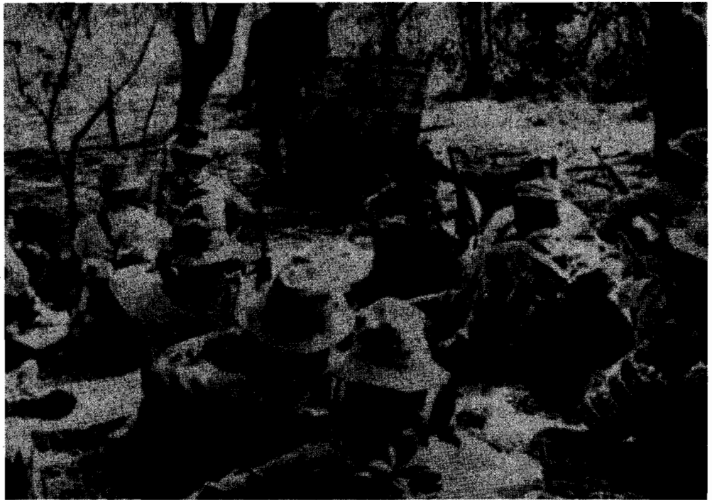
Não consideramos que haja dois movimentos de Libertação no Zimbabwe. Se há divisão é assunto interno do A.N.C. Mas os objectivos imediatos são os mesmos: a libertação do Zimbabwe e o Governo de maioria