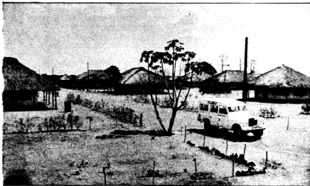
Aspecto do bairro dos trabalhadores da unidade de produção, ainda em construção, a fim de acolher também os ex-improdutivos

Uma das unidades de produção que tivemos ocasião de visitar, acompanhando uma parte da brigada do Comando Central Operativo, foi a de Meserpane. Esta unidade tem 1600 hectares de algodão, 150 de milho, 20 de mandioca, 126 de sisal e 440 de feijão.