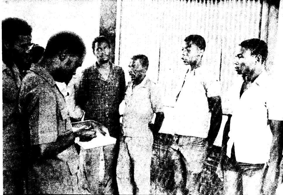
Ouvir a opinião e as preocupações de cada evacuado foi a preocupação da brigada do Comando Central Operativo

Para esta unidade de produção foram enviados alguns improdutivos, que foram imediatamente integrados na apanha do algodão, construção de casas e trabalho oficial, de acordo com as aptidões de cada um e as necessidades imediatas da empresa.