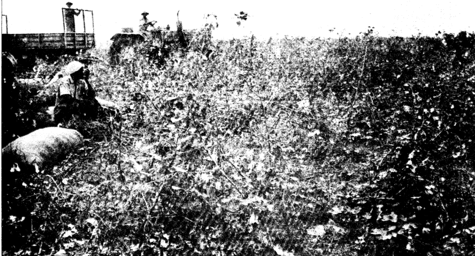
A machamba de algodão da Unidade de Produção de Meserpane, onde foram integrados alguns ex-improdutivos

conta os erros que foram cometidos até então.