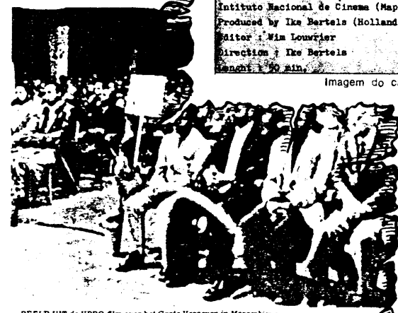
BEELD UIT DE VPRO-film over het Grote Vergeven in Mozambique.

ral-praat; maar ook voor Mouchikine's 'Molie'.