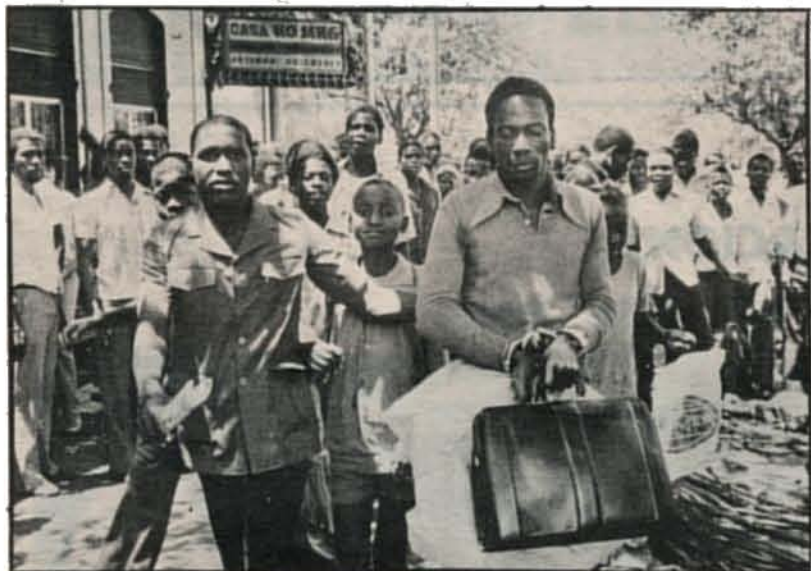
Luta contra a candonga. Imagem da primeira acção de vulto desencadeada contra a candonga em Maputo