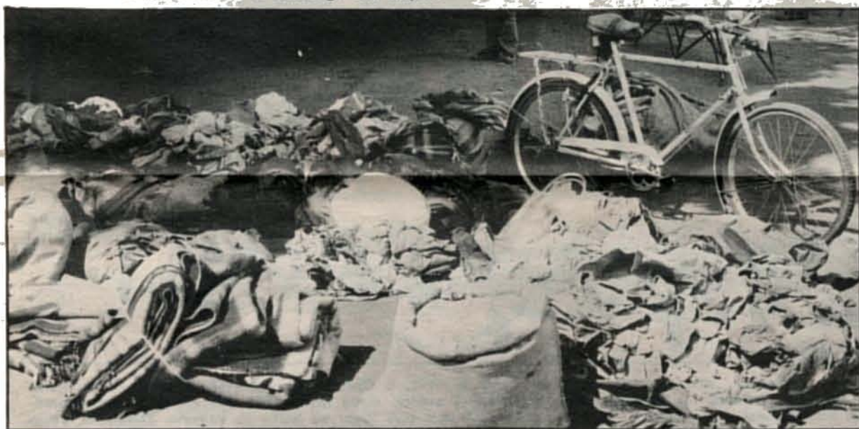
Produtos e artigos que haviam sido roubados pelas bandas armadas à população e que foram recuperados pelas FPLM