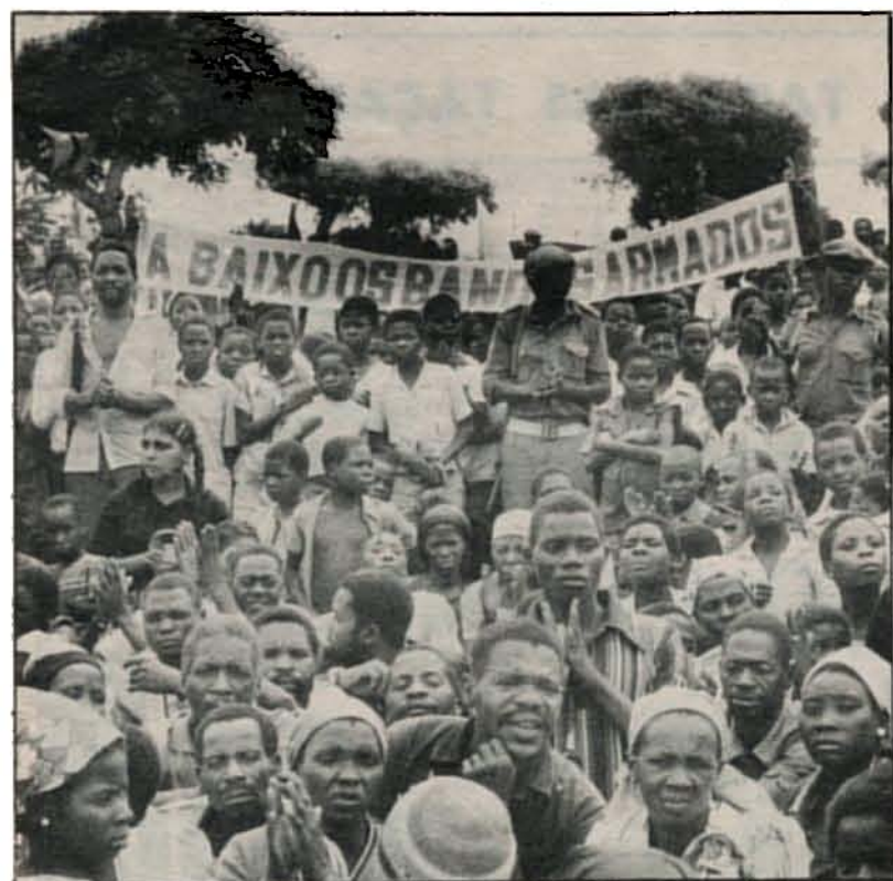
A população de Gaza exigiu que aos candongueiros fosse dado o mesmo tratamento que aos bandidos armados