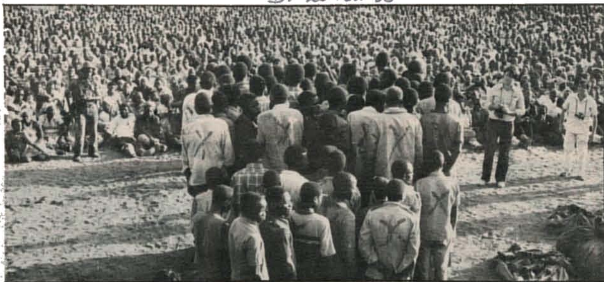
Alguns dos bandidos armados apresentados no comício de terça-feira em Chibuto