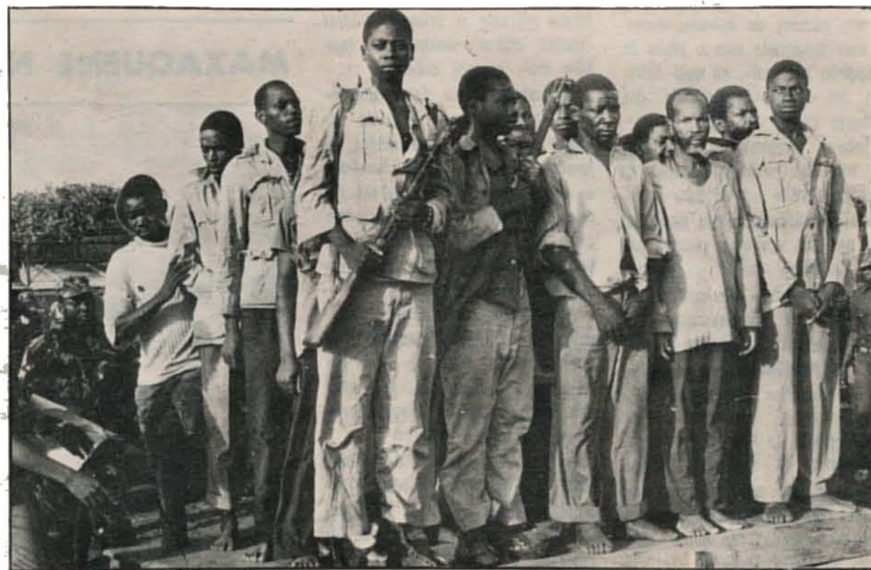
Bandidos armados, durante o comício de Chibuto, sendo apresentados à população. Alguns trazem consigo as armas com que foram capturados